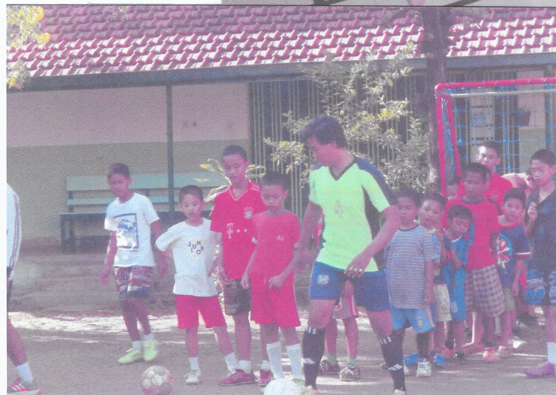
Kinderen tijdens een voetbal oefeningen.