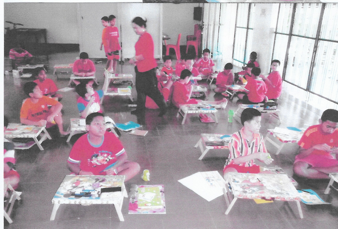
Kinderen tijdens tekenen en kust-oefeningen.