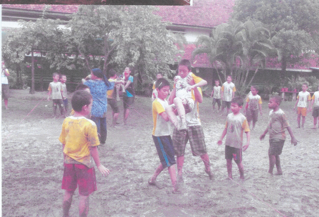
Kinderen spelen in de modderpoel in het tehuis na de banjir. Maar een harde regenbui.