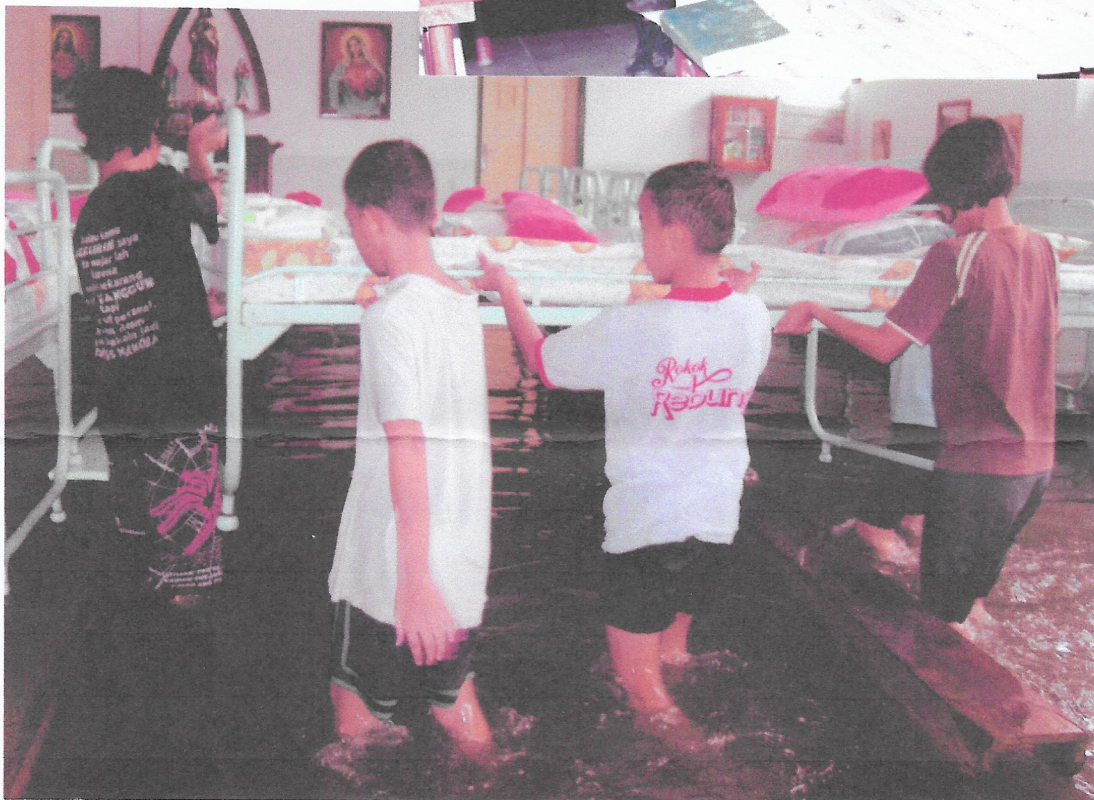
Kinderen helpen de bedden hoger te zetten tijdens de overstroming van de regenwater.