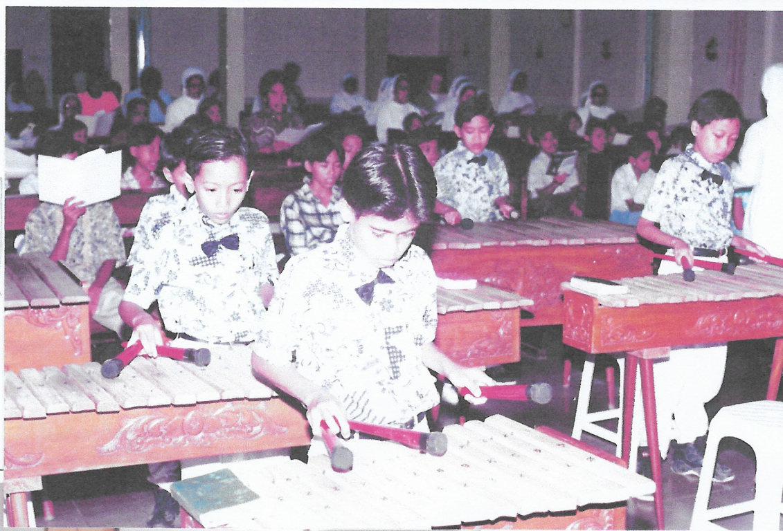
Kinderen bespelen de Kolintang muziek-instrument tijdens de Heilige Mis in de kapel van Don Bosco.