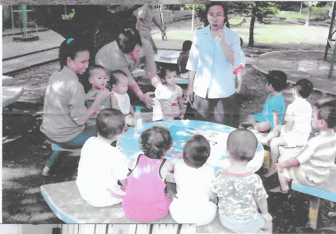
De kleuters-afdeling met de Zuster en helpster.