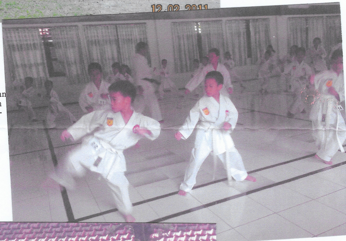
Een groep kinderen van Don Bosco tijdens een selectie voor Karate-competitie.