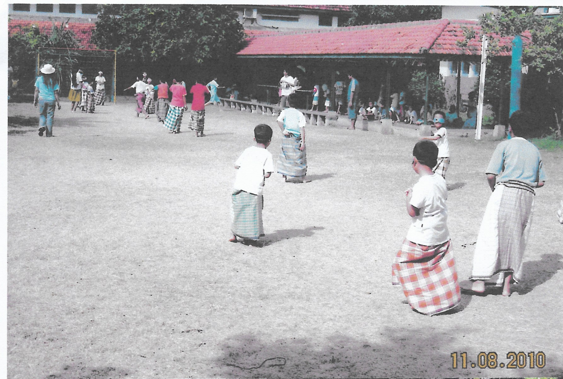
Voetbal wedstrijd met sarung tijdens vrijheidsdag Indonesia 17 Augustus.