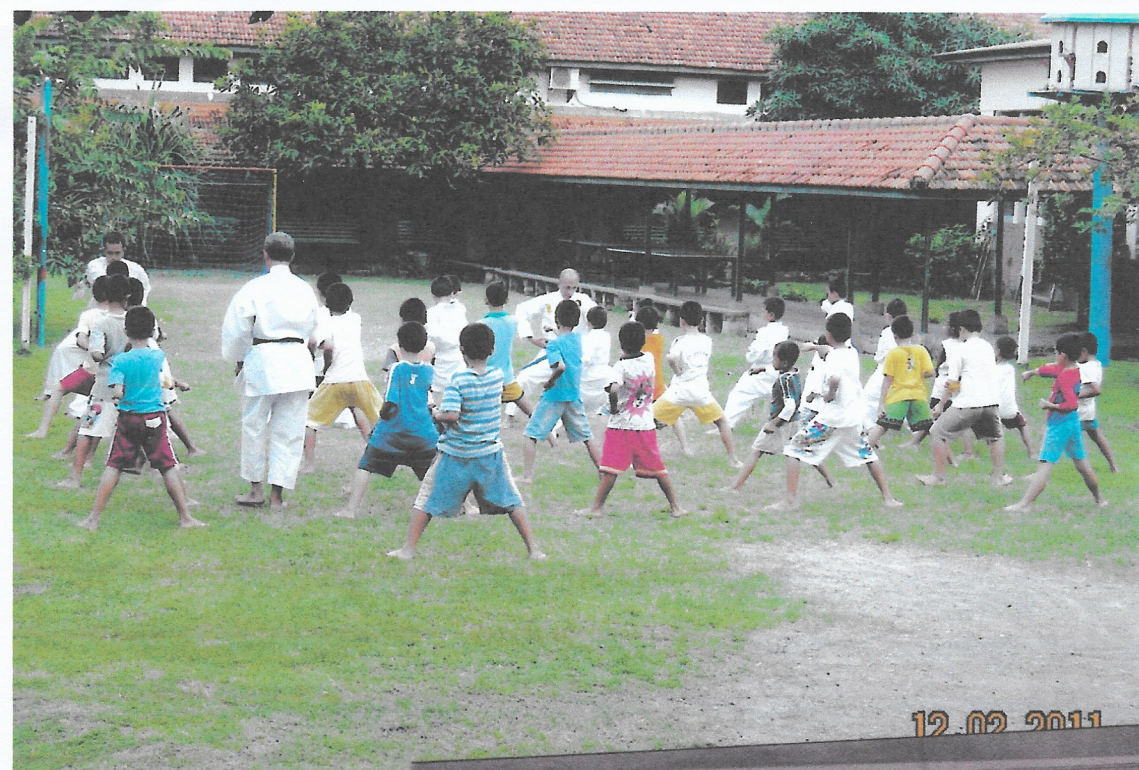
De eerste begin van de Karate-oefeningen voor selecteren van de belangstellende.